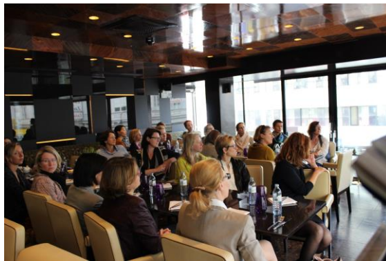
31.03.2016- Brigitte Ederer